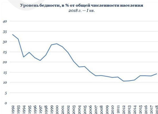
Таблица 1. Динамика уровня бедности в России (1992–2018 г.г.)