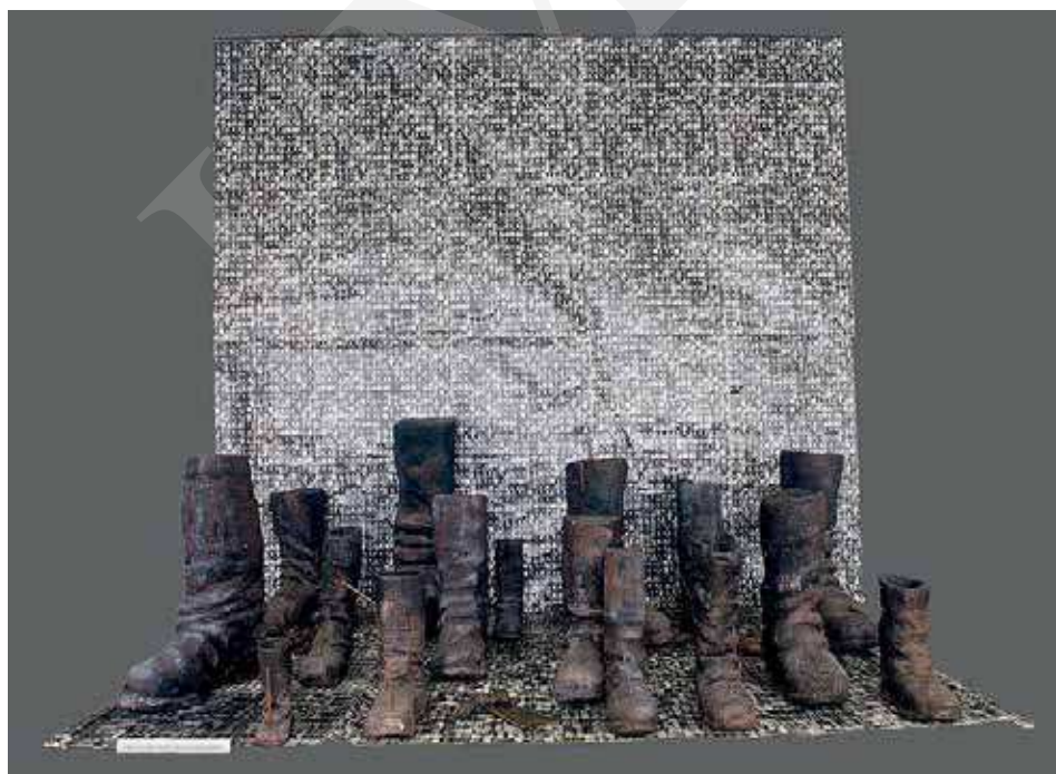
Ilustracja 5. J. Szajna, Drang nach Osten – Drang nach Westen , źródło: http://dmochowskigallery.net/galeria_zoom.php?artist=4&picture=3251 [data dostępu: 30.08.2018].