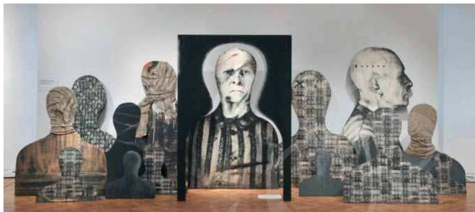
Ilustracja 4. J. Szajna, Reminiscence , źródło: https://muzeumslaskie.pl/pl/kalendarium/reminiscence-jozefa-szajny-panel-dyskusyjny [data dostępu: 25.10.2018].