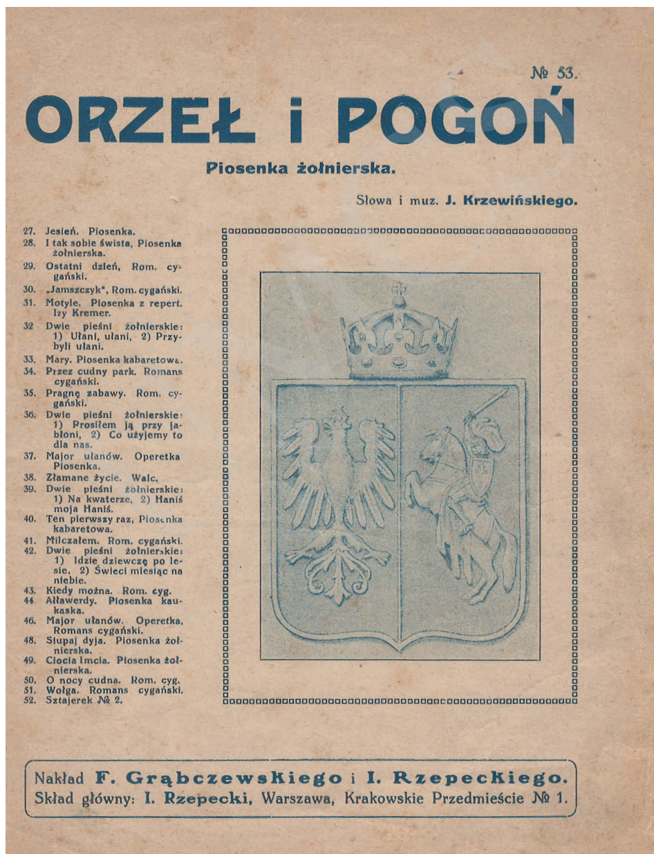
Ilustracja 2. Orzeł i Pogoń , słowa i muzyka Julian Krzewiński, druk z serii Wydawnictwa miniaturowe (nr 53), Warszawa b. r. w. (między 1921 a 1928); cd. na s. 92-93.