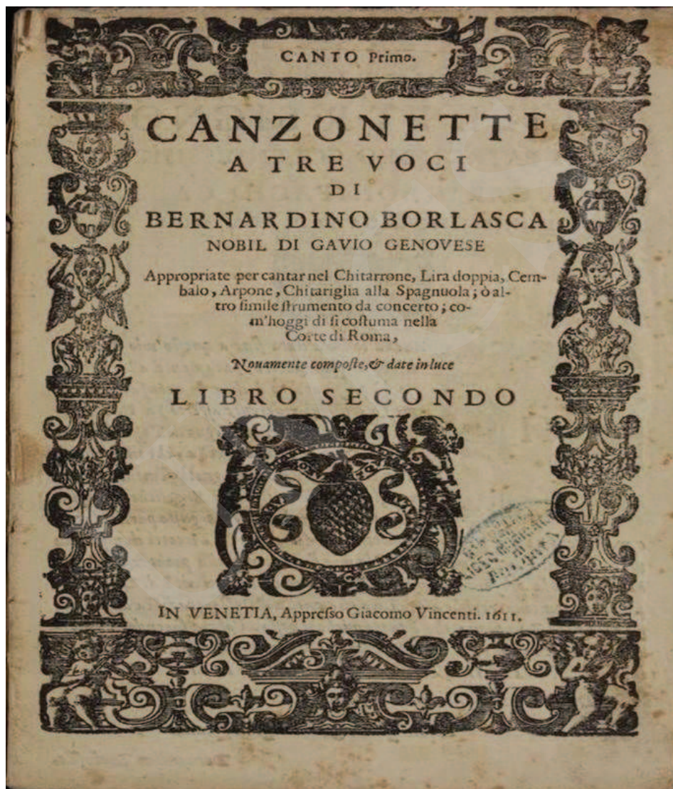
Ilustracja 4. Bernardino Borlasca, Canzonette , I-Bc, sygn. X. 140.