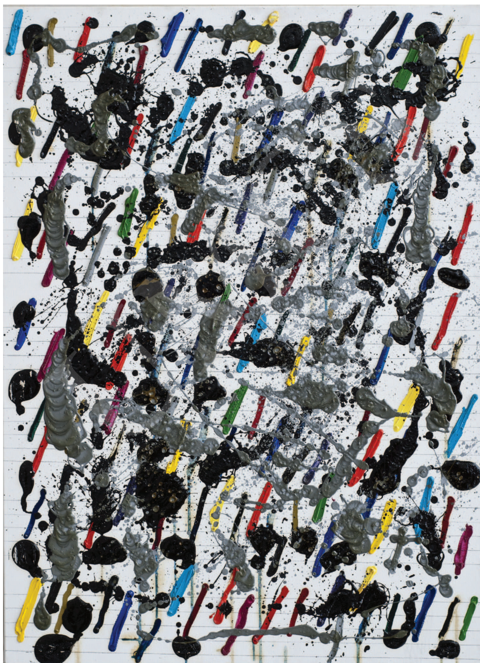
Ilustracja 1. W. Pawlak, Partytura do baletu Sokrates III , 2003, 73x100 cm