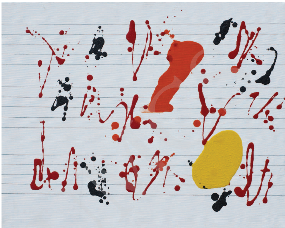
Ilustracja 3. W. Pawlak, Partytura do baletu Sokrates XXXXXXXXXVIII , 2008, 40x50 cm, fot. K. Kuzko