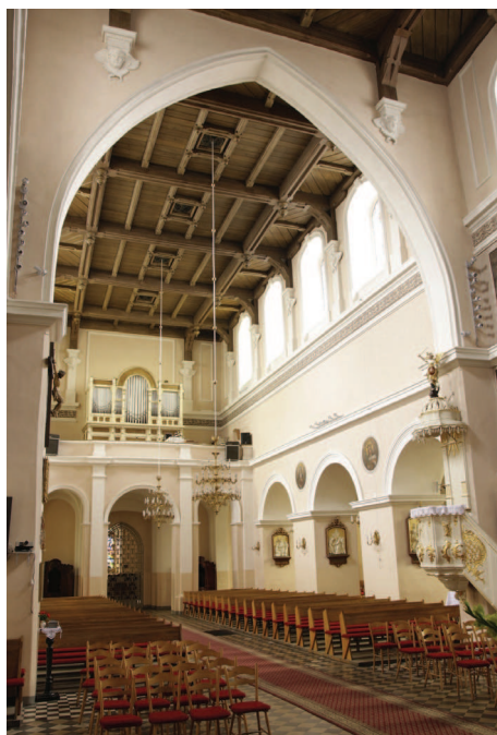
Ilustracja 3. Kościół farny we Wrześni – widok wnętrza ku zachodowi z prezbiterium, fot. M. Potocki (2009)