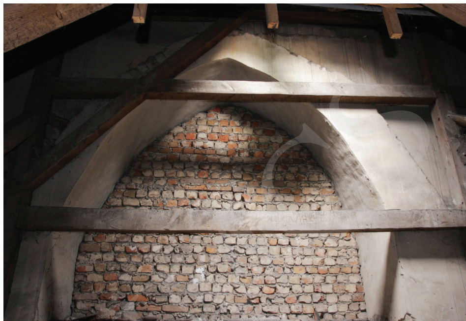
Ilustracja 6. Kościół farny we Wrześni – widok z poddasza nawy południowej na gotycką arkadę międzynawową