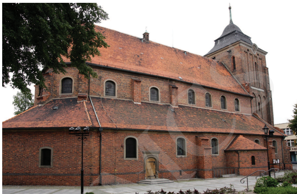
Ilustracja 1. Kościół farny we Wrześni – widok od strony północnej (2009)