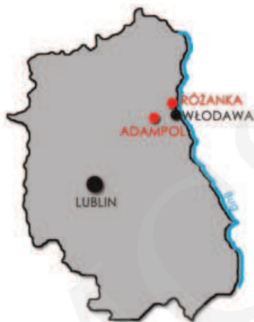
Ilustracja 1. Lokalizacja zespołu pałacowego w Różance i Adampolu na tle aktualnych granic Województwa Lubelskiego, 2014 (oprac. M. Boguszewska)