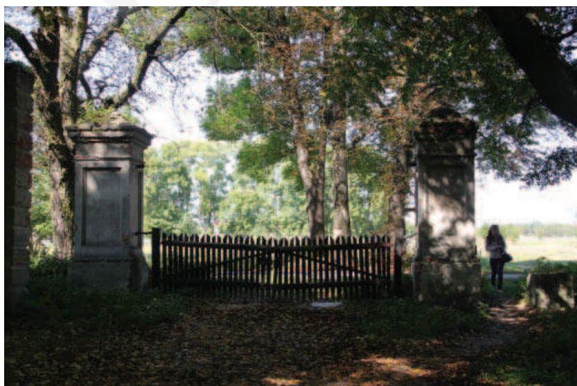
Ilustracja 9. Filary bramy w Różance.