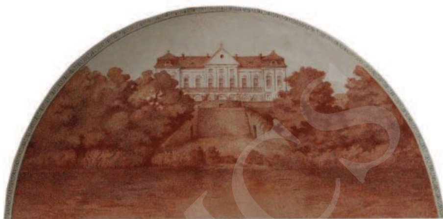
Ilustracja 4. Widok na pałac od doliny Bugu – malowidło w pałacu w Adampolu. (Fot. M. Boguszewska 2014)