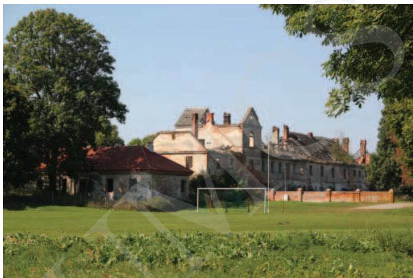
Ilustracja 8. Pozostałości zabudowań w Różance.

Obecny właściciel dokłada wszelkich starań, by całość założenia w Adampolu była zadbane i przechodziła konieczne remonty. Budynki towarzyszące niegdyś pałacowi (leśniczówki, dom gajowego) w chwili obecnej zostały zaadaptowane na pomieszczenia administracyjne oraz budynki mieszkalne.