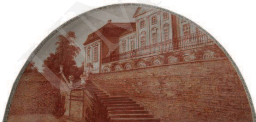
Ilustracja 5. Taras przypałacowy – malowidło z pałacu w Adampolu.