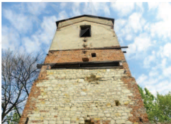
Ilustracja 6. Budynek suszarni chmielu – elewacja południowa.

Przeprowadzone analizy wskazują na brak opieki i niszczące zmiany w substancji zabytkowej parku i budynków zespołu dworskiego w Łęcznej. Inwentaryzacja ukazała zarastanie parku krajobrazowego, gdzie drzewa i krzewy tworzą niekontrolowane, przypadkowe skupiska oraz niszczące budynki folwarku. Niewątpliwie jednak obiekt zasługuje na uwagę ze względów historycznych, przyrodniczych oraz jako zabytek sztuki ogrodowej.