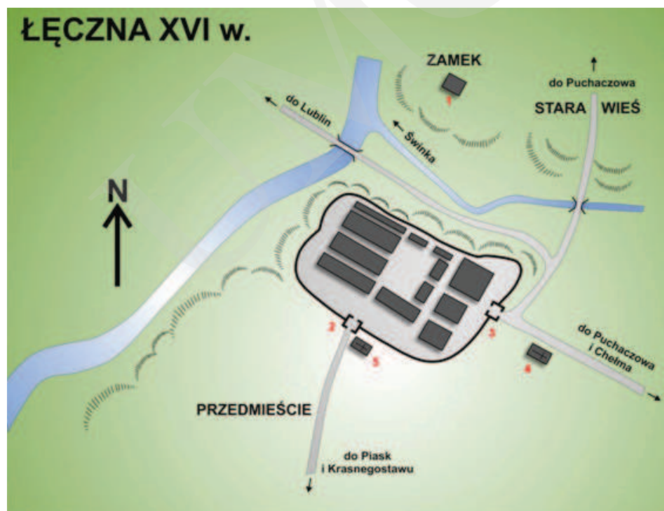
Ilustracja 1. Rekonstrukcja układu przestrzennego miasta Łęczna w XVI wieku. 1 – Zamek; 2 – Brama Krasnostawska; 3 – Brama Chełmska; 4 – Kościół parafialny; 5 – Kościół szpitalny Św. Ducha, oprac. M. Dudkiewicz, wg Maciuka, [w:] Łęczna. Studia z dziejów miasta , red. E. Horoch, Łęczna 1989, s. 38.

Pierwsza wzmianka o Łęcznej – z pisownią Laczna – pochodzi z 1252 roku. Była to wówczas własność opactwa sieciechowskiego, a później, w roku 1428, Stefana z Łęcznej. Ziemie łączyńskie leżały na granicy wpływów Małopolan, pomiędzy województwem chełmskim i Księstwem Halicko-Wołyńskim, co prawdopodobnie było przyczyną wzniesienia na skraju wysokiego ujścia Świnki do Wieprza zamku obronnego 1 (zob. il. 1). 7 stycznia 1467 roku Kazimierz Jagiellończyk nadał Łęcznej prawa miejskie. Miasto osadzono na 36 łanach na skrzyżowaniu dwóch szlaków handlowych: z Wołunia do Lublina, i z Podkarpacia na Podlasie 2 .