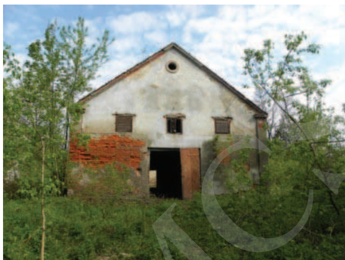
Ilustracja 5. Budynek magazynu – elewacja południowa (2012).