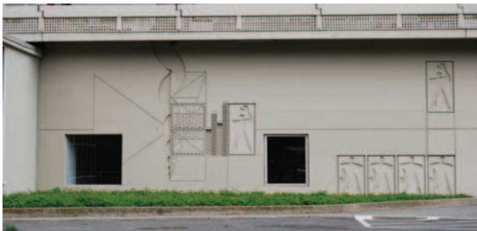
Ilustracja 12. Modułor na elewacji Jednostki Berlińskiej, fot. A. Pilip (2010).