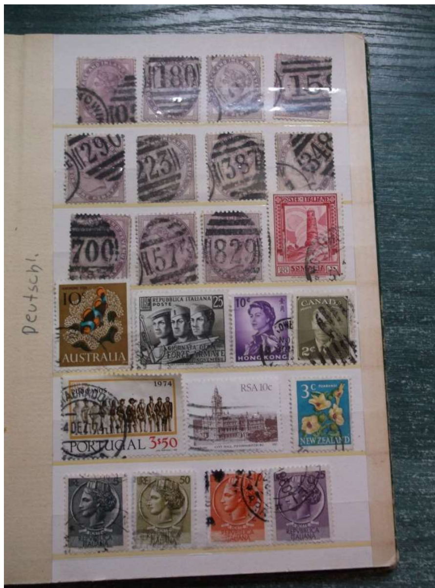
Fot. 3. Jedna ze stron

z różnych krajów świata. Belgia sąsiaduje z Indiami, Argentyna leży obok Szwajcarii, gdzie indziej Włochy, Chile oraz Szwecja, Turcja i Kanada. Ta specyficzna topografia czyni z albumu niepowtarzalny przedmiot i miejsce swoiste. Staje się on też szczególnym odwzorowaniem świata.