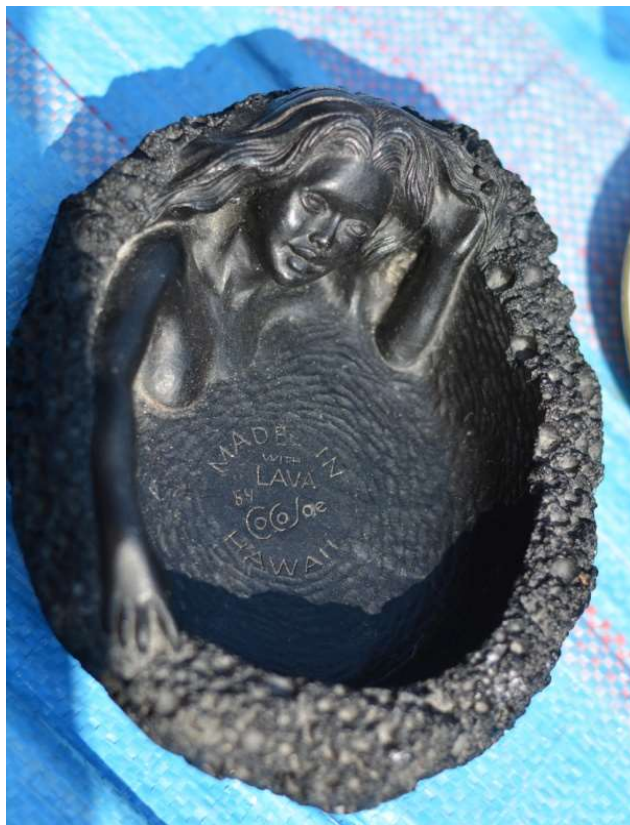
Fot. 7. Popielniczka

Dzięki katalogowi 8 dowiemy się, że kobieta z Amberley to Wiktoria, królowa Wielkiej Brytanii, do której Nowa Zelandia należała, gdy znaczek stemplowano. Dowiemy się też, że znaczek wydrukowano w Government Printing Office w Wellington na Wyspie Północnej w 1882 r. a zaprojektowano w 1874 r. w firmie Thomas De La Rue & Co. w Basingstone w Anglii. Uwikłanie znaczka nie dotyczy tylko czasu i miejsca ostemplowania. Są inne miejsca i czasy ważne dla jego istnienia i posiadanych przez niego własności, znaczeń, wartości. Nie byłoby go tutaj, gdyby nie został w 1882 r. wydrukowany w Wellington w firmie mieszczącej się w budynku na rogu Lambton Quay i Bunny Street, którą kierował George Didsbury. Nie byłoby go też, gdyby 8 lat wcześniej nie został zaprojektowany w angielskim mieście w firmie Thomasa De La Rue. Swoją nominalną wartością znaczek uwikłany jest w brytyjski system pieniężny, używany na Wyspach od średniowiecza do 1971 r. Wartość dwóch pensów związana jest z wartością jednego. Z kolei jeden pens to 1/12 szylinga, skoro szyling to 12 pensów.