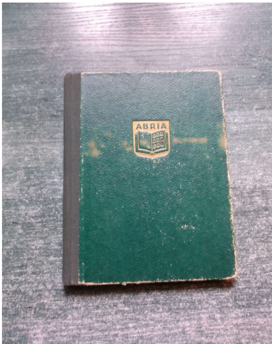
Fot. 1. Kłaser

ludzie zapelniają także okoliczne uliczki, skwery. Na ul. Różanej na chodniku przy budynku Sądu Okręgowego wśród wypełnionych kartonów jest jeden z klaserami, z których wysypują się pocztowe znaczki. Wśród nich mały klaser o wymiarach 18,5 x 13,5 cm: