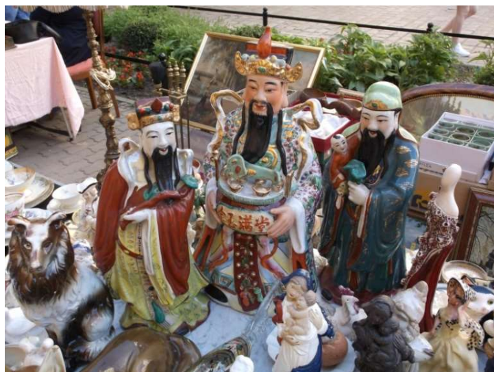
Fot. 5. Przybysze ze Wschodu

znaczki wraz z wieloma innymi przedmiotami na świdnickim Rynku w specyficzny sposób wychodzą naprzeciw postulatam autorek. Przybyły tu z różnych miejsc. Mniej lub bardziej odległych. Kiedyś były ich integralną częścią, a teraz są elementem świdnickiego spotkania, nie tracąc związków z miejscami pochodzenia i poprzedniego pobytu. I nadal są fragmentami tych miejsc. Stanowią więc między lokalnością Rynku i wieloma innymi lokalnościami różnych regionów świata. Znaczki nie są tu wyjątkiem. Czynią to z ogromem innych przedmiotów obecnych tu w tą niedzielę. Na przykład na innym stoisku wśród ceramicznych figurek, z których dzięki sygnaturom można odczytać miejsca produkcji i pochodzenia stoją i rozglądają się trzy orientalne postacie. Nie odnalazłem przy nich żadnych oznaczeń produkcji, lecz przypuszczam, że są przybyszami z dalekiego wschodu świdnickiego Rynku.