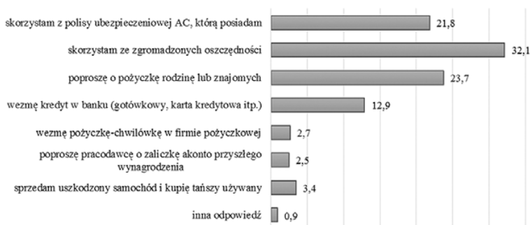
Rys. 2. Źródła finansowania nieprzewidzianych wydatków przez Polaków