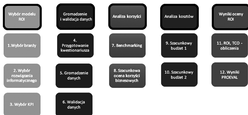
Rys. 3. Szczegółowy proces oceny PROEVAL