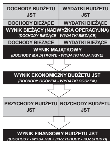
Rys. 1. Elementy równoważenia budżetu JST