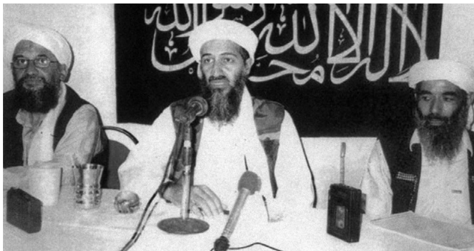
Rys. 1. Goście audycji propagującej przez internet terroryzm

tylko o potomków muzułmańskich imigrantów ulegających radykalizacji religijnej i ideologicznej, ale również o młodych ludzi zafascynowanych nową religią i nową ideologią. Minister bezpieczeństwa USA, Michael Chertoff, składając wyjaśnienia przed senacką Komisją Bezpieczeństwa Wewnętrznego i Spraw Rządowych, powiedział, że internet jest obecnie głównym medium, przez które Al-Kaida zdobywa zwolenników w USA.