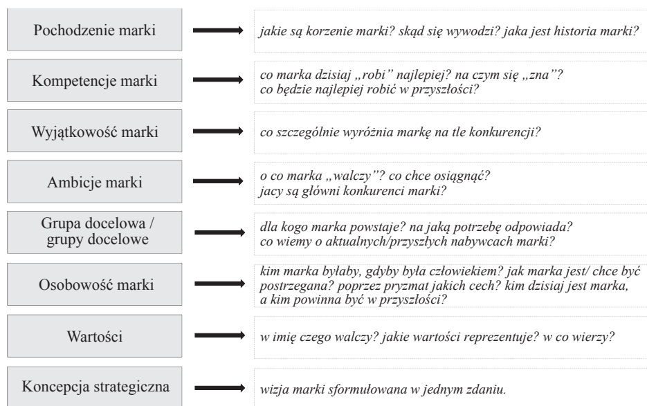
Rysunek 1. Brand Foundations – strategia marki wg firmy Corporate Profiles Consulting