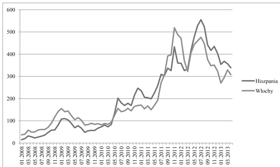
Rysunek 1. Spread między 10-letnimi obligacjami niemieckimi a instrumentami emitowanymi przez Hiszpanię i Włochy w okresie styczeń 2008–marzec 2013 roku (w punktach bazowych)

spread między mającymi najwyższą rentowość papierami greckimi a instrumentami niemieckimi wynosił 1038 punktów bazowych, a więc o 1614 punktów bazowych mniej niż w czerwcu 2012 roku.