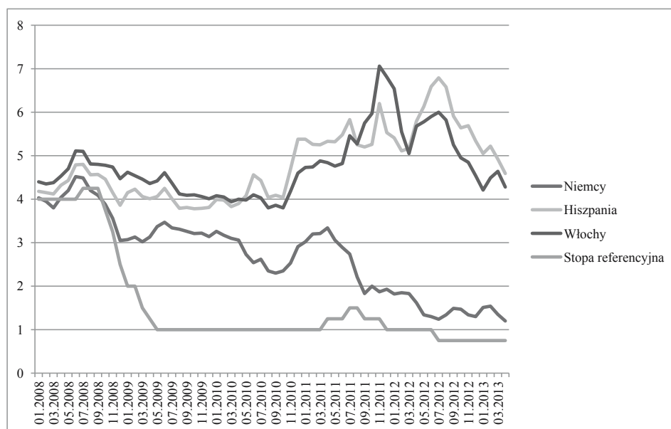
Rysunek 2. Stopy referencyjne EBC i rentowność rządowych papierów dłużnych wybranych państw strefy euro w okresie styczeń 2008–marzec 2013 roku (w %)

gospodarczej w strefie euro, stopy procentowe EBC zwiększono o 25 punktów bazowych. Do następnej takiej podwyżki doszło 13 listopada 2011 roku. 9 listopada 2011 roku rozpoczął się natomiast kolejny okres obniżek stóp procentowych. W wyniku czterech decyzji stopa referencyjna została zredukowana o 100 punktów bazowych, zaś stopa depozytowa osiągnęła poziom 0%. W ten sposób stopy procentowe w strefie euro osiągnęły historyczne minimum.