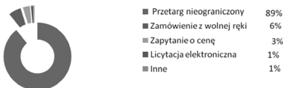
Rys. 3. Zamówienia publiczne według zastosowanego trybu w ujęciu procentowym w pierwszym kwartale 2015 r.