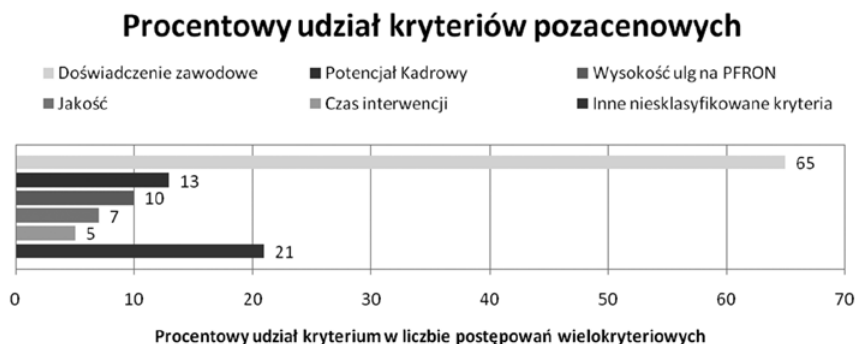
Rys. 2. Procentowy udział pozacenowych kryteriów oceny ofert w zamówieniach na usługi ochrony w 2013 r.

Przetargi, w których stosowano kryteria inne niż cena, stanowiły tylko 7% ogółu wszystkich zamówień publicznych na usługi ochrony. Wśród tej grupy najpopularniejsze kryteria zostały zaprezentowane na rys. 2. Odsetki te nie sumują się do 100%, ponieważ niektórzy zamawiający wybrali więcej niż jedno kryterium pozacenowe.