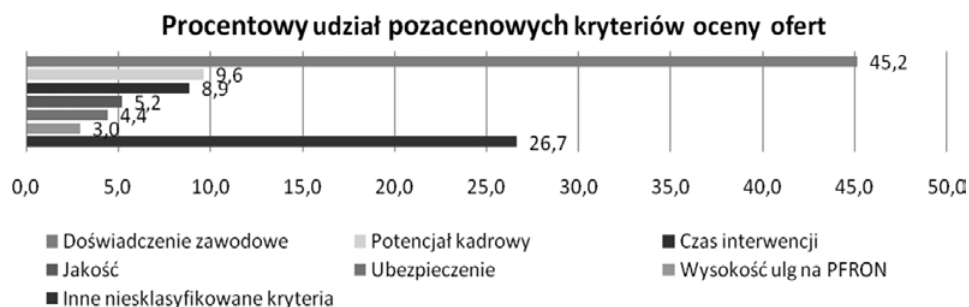
Rys. 4. Stosowanie pozacenowych kryteriów oceny ofert w zamówieniach na usługi ochrony w pierwszym kwartale 2015 r.