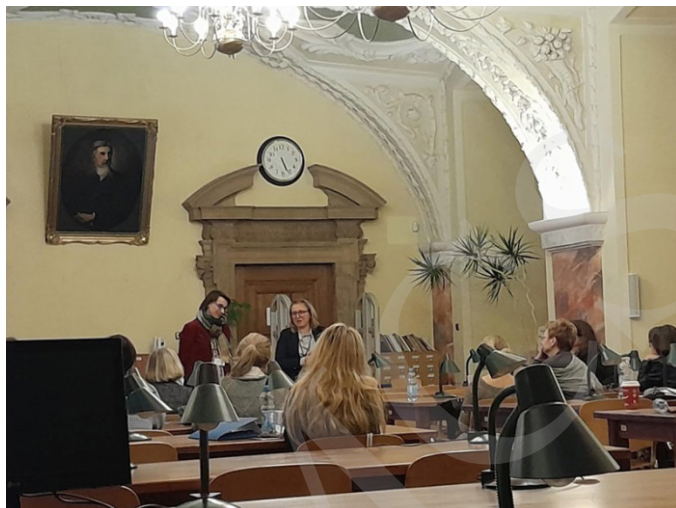
Fot. 11. Prezentacja jednego z wystąpień.