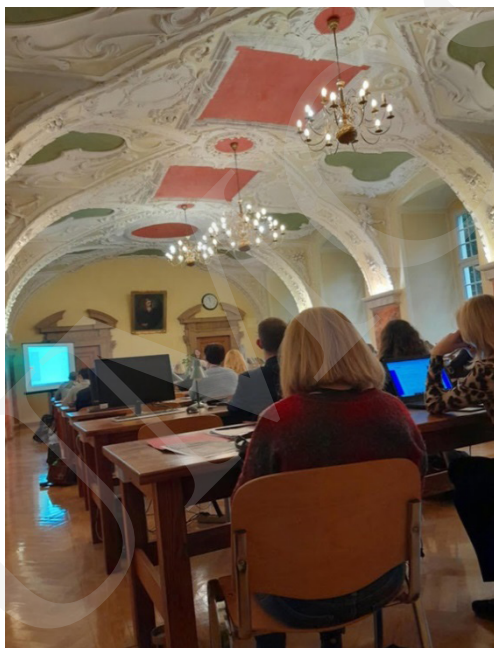
Fot. 9. Prezentacja jednego z wystąpień.

króla, „wziąć pod rękę Marsa, by wspomagać go w lepszych czasach”. Tło polityczne stanowił powrót Króla Zygmunta III Wazy z podróży do Szwecji, a wątki poruszane w poemacie są odwołaniem do złych nastrojów i bezprawia, jakie opanowały Starą Warszawę i Nowe Miasto.