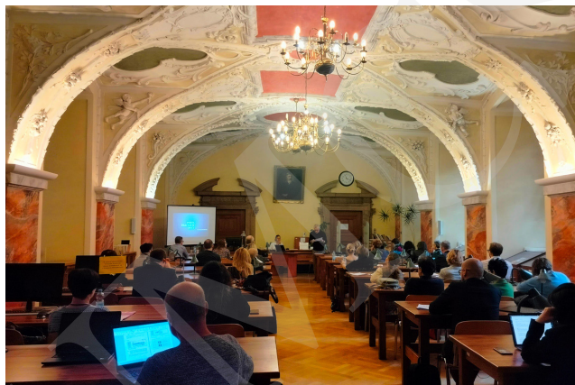
Fot. 8. Prezentacja jednego z wystąpień.

Wystąpienie to zamykało pierwszy dzień konferencji.