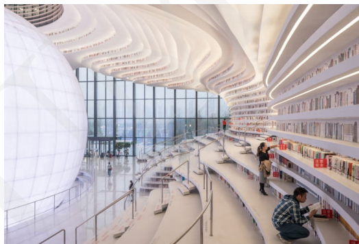
Fot. 11. Biblioteka Binhai w Tianjin, fot. Ossip van Duivenbode. Źródło: https://www.bryla.pl/bryla/7,85298,22639247,futurystyczna-biblioteka-w-chinach-od-mvrdrv.html .

Przykłady te pokazują, jak bardzo innowacyjne potrafią być budynki biblioteczne łączące funkcjonalną architekturę, estetykę i zaawansowaną technologię. Widoczne jest tworzenie miejsc przyjaznych czytelnikowi, sprzyjających nauce i integracji społecznej. Biblioteki tym samym odpowiadają na zmieniające się potrzeby społeczeństwa i rozwój technologiczny.