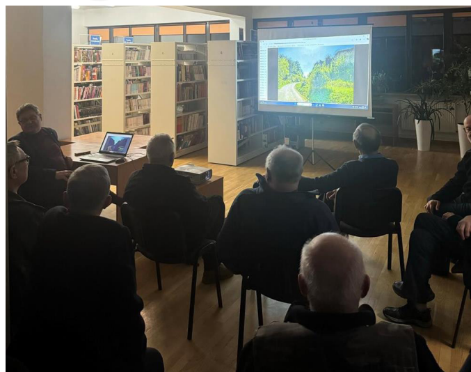
Fot. 5. Wykład Stowarzyszenia Miłośników Dawnej Broni i Barwy.