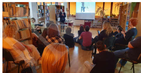
Fot. 4. Spotkania z mangą i anime.