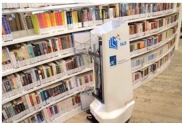
Fot. 14. Robot AuRoSS.

Rozwój technologii ma za zadanie ułatwienie pracy. Do czasochłonnych prac wykonywanych w bibliotece, takich jak inwentaryzacja czy weryfikacja tego, czy książka znajduje się we właściwym miejscu na regale, wykorzystuje się roboty magazynowe. Przykładem takiego robota jest wynaleziony przez singapurskich naukowców AuRoSS ( Autonomous Robotic Shelf Scanning System ). Robot ten samodzielnie przemieszcza się między regałami bibliotecznymi i wykorzystując technologię RFID, skanuje książki, następnie generuje raport o brakujących lub źle odłożonych pozycjach. Według badań robot ten osiągnął poziom dokładności wynoszący 99% 28 .