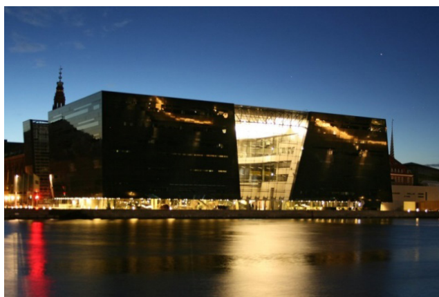
Fot. 7. Biblioteka Królewska w Kopenhadze.

W XXI w. nowo wybudowane budynki biblioteczne stały się przykładami nowoczesności, łącząc tradycyjne funkcje z innowacyjnymi rozwiązaniami technologicznymi i architektonicznymi. Jedną z najnowocześniejszych bibliotek w Europie jest Biblioteka Królewska w Kopenhadze powszechnie nazywana „Czarny Diament” ze względu na charakterystyczną elewację z czarnego granitu. Budynek znajduje się