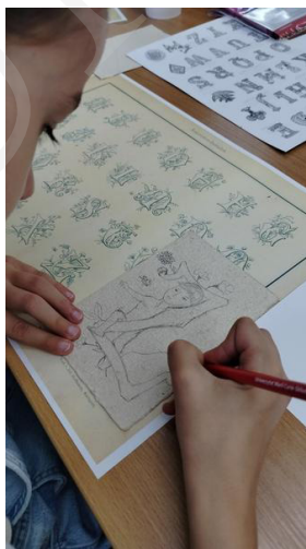
Fot. 9. Precyzyjne szkicowanie projektu, fot. A. Mikulska.

Warsztaty cieszyły się dużym zainteresowaniem, a uczniowie we wszystkich grupach wiekowych wykazali się zaangażowaniem podczas realizacji zadań, korzystając z wiedzy uzyskanej podczas części wprowadzającej. Młodszy uczestnicy pomimo wyższego stopnia trudności związanego z początkami nauki pisania wyróżniali się dużą kreatywnością. Praca dzieci przebiegała dwutorowo – część uczniów skoncentrowała się na pierwszym etapie projektowania inicjału i tworzeniu szkicu, starając się zagospodarować całą powierzchnię kartki i wielokrotnie nanosząc poprawki. Wśród pozostałych „iluminatorów” w akcie twórczym dominowała spontaniczność i odważna ekspresja przy zastosowaniu łączonych materiałów, jak farby, brokat, elementy dekoracyjne. We wszystkich grupach wiekowych ważnym czynnikiem okazało się wskazywanie etapów pracy oraz określanie ram czasowych dla poszczególnych części zadania. Pomocą metodyczną dla prowadzących stanowił plan pracy w formie opracowanego autorskiego scenariusza zajęć, jako punkt odniesienia pomocny przy moderowaniu działań uczniów. Przewidywany czas zajęć wynosił 60 minut, co wymuszało intensywne tempo pracy, wydawało się jednak optymalne z uwagi na możliwości utrzymania uwagi całej grupy.