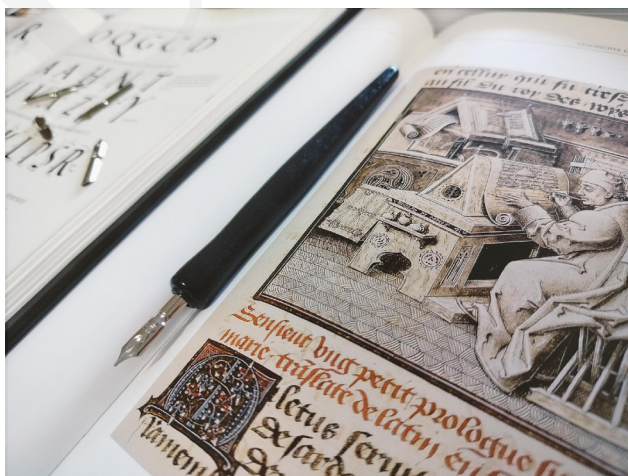
Fot. 1. Przykłady iluminacji i tradycyjnych materiałów piśmienniczych, fot. A. Mikulska.

W dniach 18–24 września 2023 roku Uniwersytet Marii Curie-Skłodowskiej w Lublinie aktywnie włączył się w organizację Lubelskiego Festiwalu Nauki. Dziewiętnasta edycja wydarzenia osiągnęła rekordowe wyniki pod względem zgłoszonych projektów – aż 1758 wydarzeń, prezentacji i warsztatów. Zgromadziła