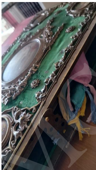
Fot. 4. Biblia w kunsztownie wykonanej oprawie, fot. A. Mikulska.

Duże wrażenie wywarła prezentacja najstarszych zasobów bibliotecznych, sięgających początków rozwoju druku, jak Biblia w przekładzie Marcina Lutera z 1686 roku o objętości około 4 tysięcy stron i wadze kilku kilogramów. Imponujące księgi oprawne w okładki wykonane z desek pokrytych tłoczoną skórą czy aksamitnym sukniem i opatrzonych dekoracyjnymi okuciami zaintrygowały odwiedzających, zapraszając do refleksji nad wartością oraz rozwojem książki w aspekcie historycznym i kulturalnym.