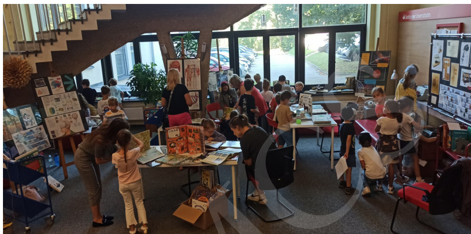
Fot. 2. Wystawa, fot. I. Mielniczuk.

Podczas 5 dni XIX Lubelskiego Festiwalu Nauki wystawę odwiedziło 20 zorganizowanych grup uczniów reprezentowanych przez klasy 0–8 szkół podstawowych z Lublina i okolic, przedszkolaki oraz osoby prywatne zainteresowane literaturą dziecięcą. W sumie wystawę odwiedziło 431 osób.