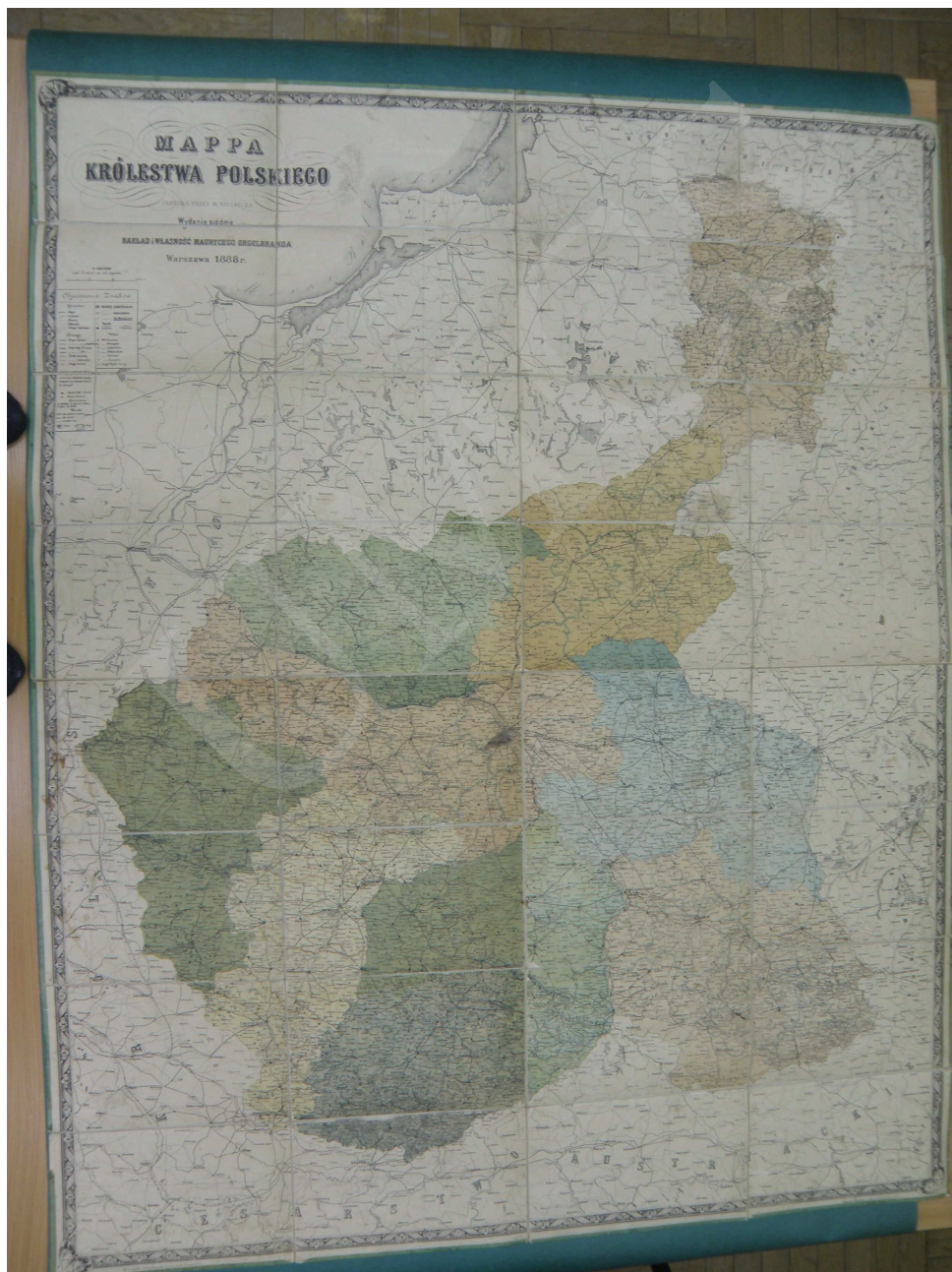
Fot. 2. Mapa Królestwa Polskiego ułożona przez M. Nipanicza