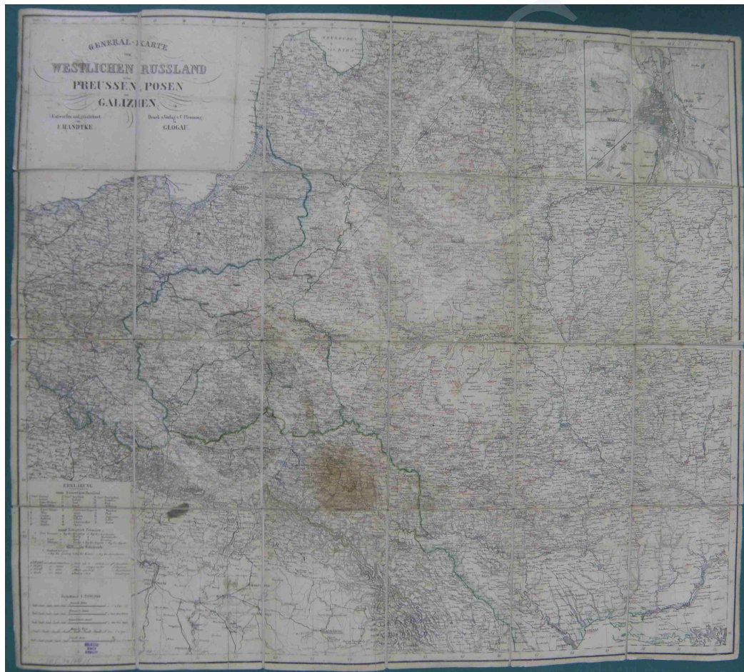
Fot. 14. General-Karte vom Westlichen Russland nebst Preussen, Posen und Galizien entworfen und gezeichnet von F. Handtke

Na mapie (fot. 14) rzeźba terenu została przedstawiona za pomocą metody kreskowej, granice zaś oznaczono kolorami. W lewym dolnym rogu umieszczono legendę oraz skalę liczbową i 5 podziałek liniowych. Dodatkowo, w prawym górnym rogu, widnieje mapa okolic Warszawy w skali ok. 1: 90 000. Mapa jest podklejona na płótnie i umieszczona w ramce.