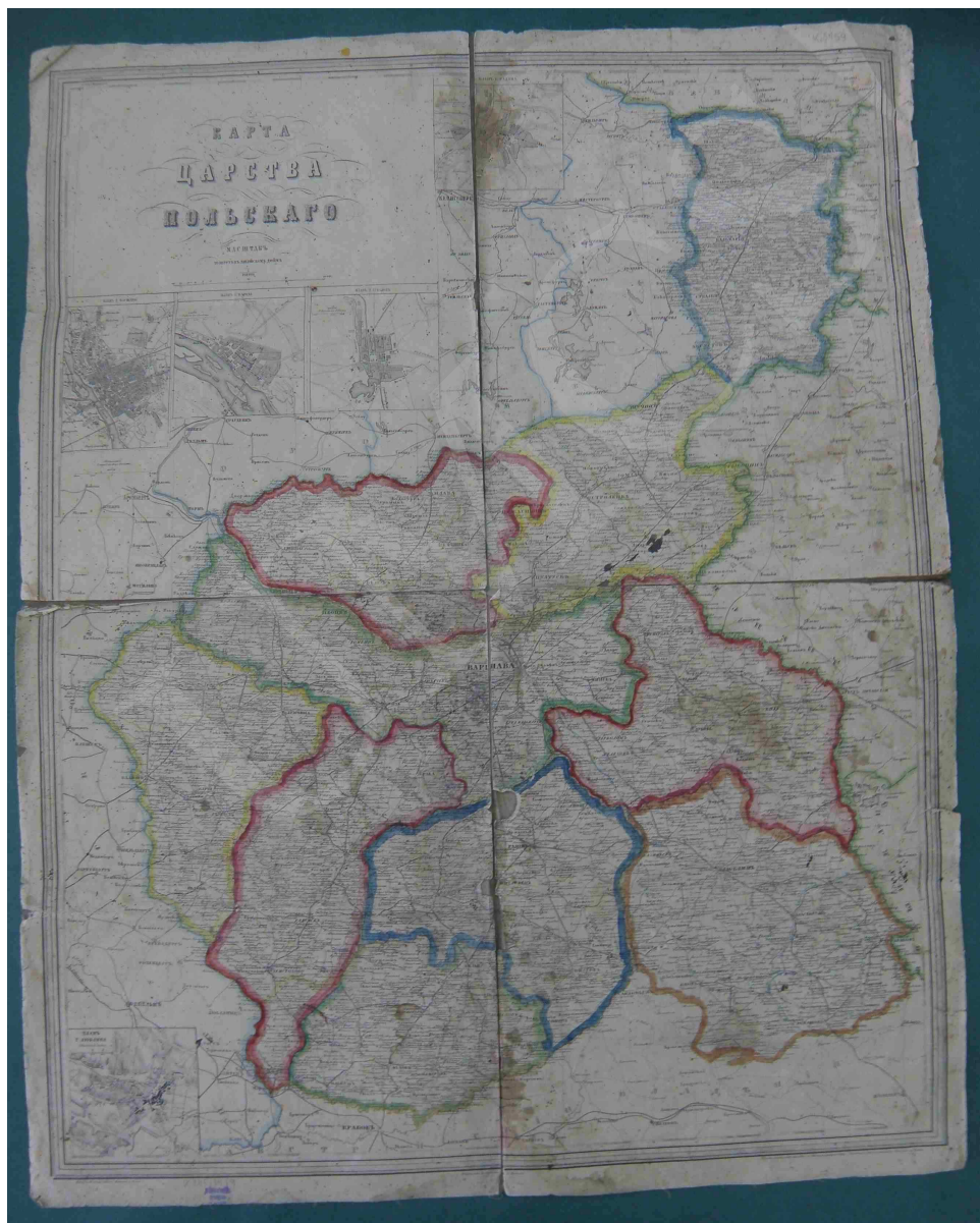
Fot. 6. Karta Carstwa Polskago