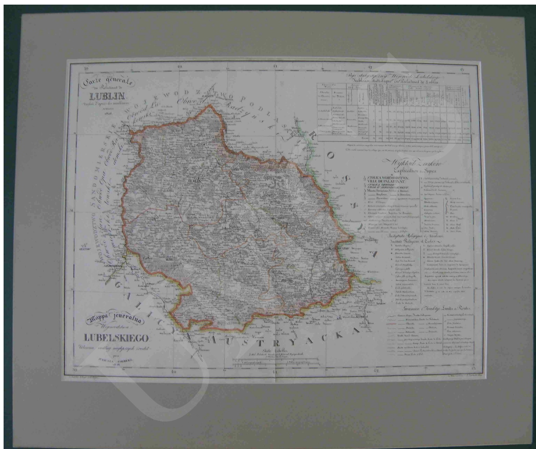
Fot. 12. Mapa jeneralna województwa lubelskiego ułożona według najlepszych źródeł przez Juliusza Colberga

Natomiast mapa województwa lubelskiego (fot. 12) została wykonana techniką litografii ręcznie kolorowanej, z zaznaczonymi granicami politycznymi i administracyjnymi. Na rysunek sytuacyjny mapy składają się elementy matematyczne, fizyczno-geograficzne, społeczno-gospodarcze oraz polityczno-administracyjne. Treść mapy uzupełniają umieszczone na arkuszu tabeli statystyczne.