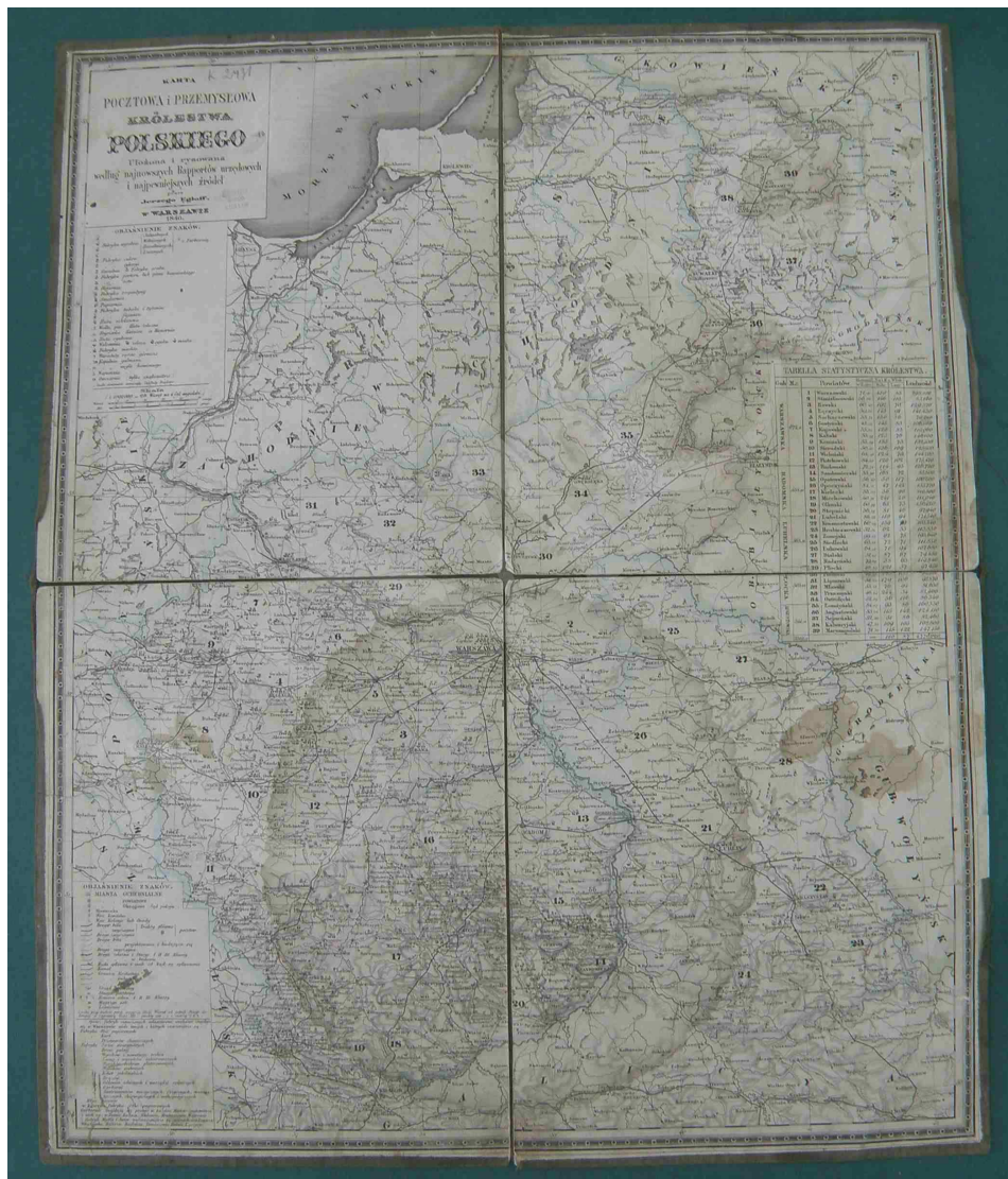
Fot. 7. Karta pocztowa i przemysłowa Królestwa Polskiego, ułożona i rysowana według najnowszych raportów urzędowych i najpewniejszych źródeł przez Jerzego Engloffa

ważności. Elementy komunikacji wodnej zostały oznaczone sygnaturą obrazkową kanałów i rzek spławnych, natomiast urzędy i stacje pocztowe – sygnaturą symboliczną – trąbką pocztyliona. Komory celne podzielono na 3 klasy. Odległości przy traktach pocztowych w granicach Królestwa Polskiego podano w wiorstach, a poza jego granicami w milach, głównie przy ważniejszych traktach pocztowych.