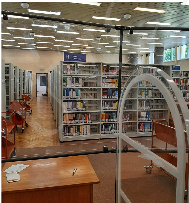
Fot. 2. Czytelnia 1 Wolnego Dostępu na parterze budynku Biblioteki UMCS.