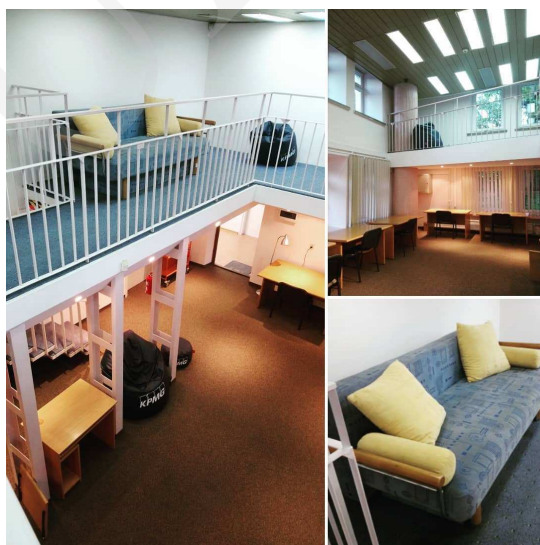
Fot. 3. Strefa relaksu i nauki w Bibliotece Głównej UMCS.