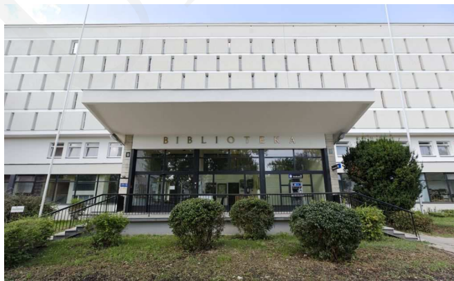
Fot. 1. Budynek Biblioteki Głównej UMCS.

Główną siedzibą Biblioteki od roku 1968 jest gmach przy w ul. Radziszewskiego 11, usytuowany w samym centrum kampusu, w bliskim sąsiedztwie budynków