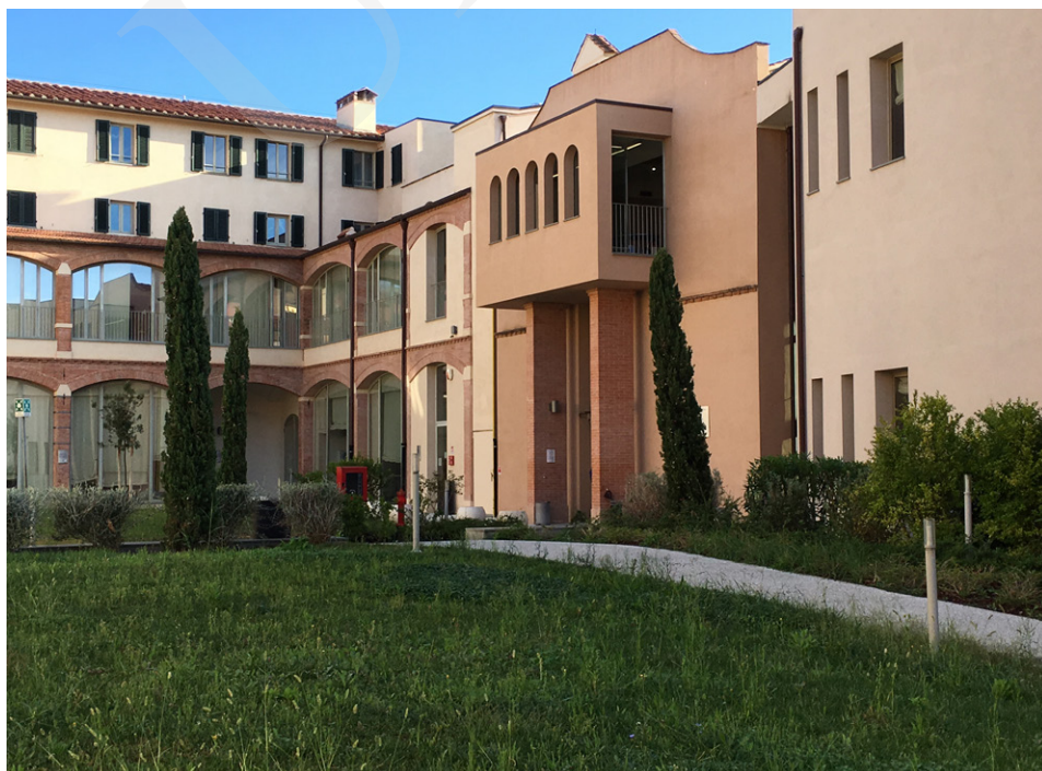
Fot. 1. Kompleks budynków POLO 6, fot. Ewa Rzeska.

Przemieszanie tradycji i nowoczesności charakterystyczne dla miasta oraz Uniwersytetu znajduje odzwierciedlenie w różnorodności architektonicznej i funkcjonalności Biblioteki Uniwersytetu w Pizie, która powstała i rozwijała się wraz z Alma Mater. Tworzy ją sieć specjalistycznych bibliotek tzw. POLO, powiązanych z poszczególnymi wydziałami: POLO 1: Rolnictwo (AGR), Ekonomia (ECO), Weterynaria (VET); POLO 2: Prawo (IUS), Nauki polityczne (SPO); POLO 3: Chemia (CHI), Matematyka, Informatyka, Fizyka (MIF), Nauki o ochronie środowiska (SNA); POLO 4: Medycyna, Chirurgia, Farmacja (MED); POLO 5: Inżynieria (ING); POLO 6: Kultura starożytna, językoznawstwo, germanistyka i sławistyka (ANT), Filologia angielska (LM2), Historia sztuki (STA), Filozofia i historia (FIL), Język i literatura romańska (LM1). Ponadto Uniwersytet posiada dwie biblioteki poza miastem: Nauk o turystyce (TUR) w Luce oraz Systemów Logistycznych (ELS) w Livorno. W Archiwum Głównym, które mieści się na peryferiach miasta, przechowywane są stare książki i dokumenty. W skład struktury Biblioteki wchodzi także Centrum Dokumentacji (CED), z którego mogą korzystać pracownicy naukowcy, studenci i pracownicy administracji uczelni. Wszystkie te jednostki funkcjonują w skoordynowanym systemie bibliotecznym, który nazywa się Sistema Bibliotecario di Ateneo, w skrócie SBA.