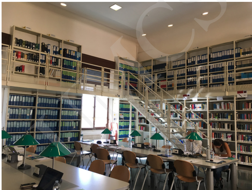
Fot. 4. Czytelnia Biblioteki POLO 5, fot. Ewa Rzeska.

Normale. Podziw może wzbudzić adaptacja pomieszczeń dawnej wieży więziennej (Palazzo della Gherardesca) na potrzeby biblioteki i jej użytkowników. Odrestaurowany niedawno Palazzo del Capitano poza funkcjonalnością jest także ciekawym obiektem architektonicznym zachowującym ślady przeszłości w postaci łuków i pamiątkowych inskrypcji widocznych na fasadzie.