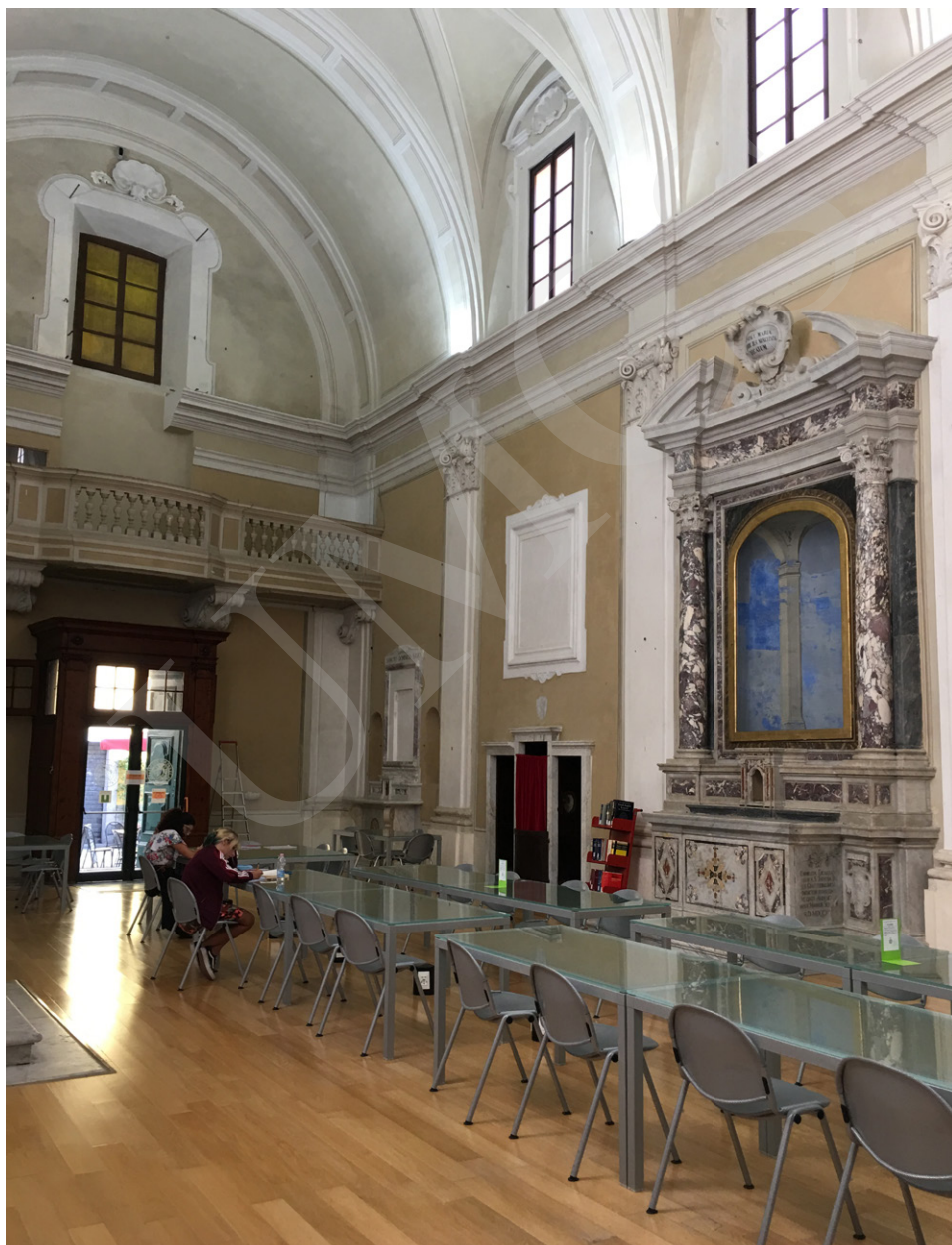
Fot. 3. Czytelnia biblioteki POLO 6, fot. Ewa Rzeska.

W trzecim dniu pobytu zwiedziłyśmy bibliotekę POLO 4 (Biblioteka Medyczna), znajdującą się w pobliżu szpitala klinicznego. Zapoznaliśmy się z e-zasobami biblioteki (bazy danych, e-czasopisma, e-książki) oraz tworzonymi przez Bibliotekę