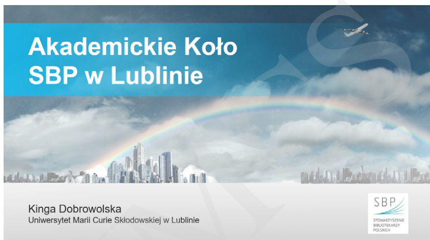
Fot. 1. Fragment prezentacji.

– w chwili obecnej to jedyna laureatka tej prestiżowej nagrody wśród bibliotekarzy akademickich.