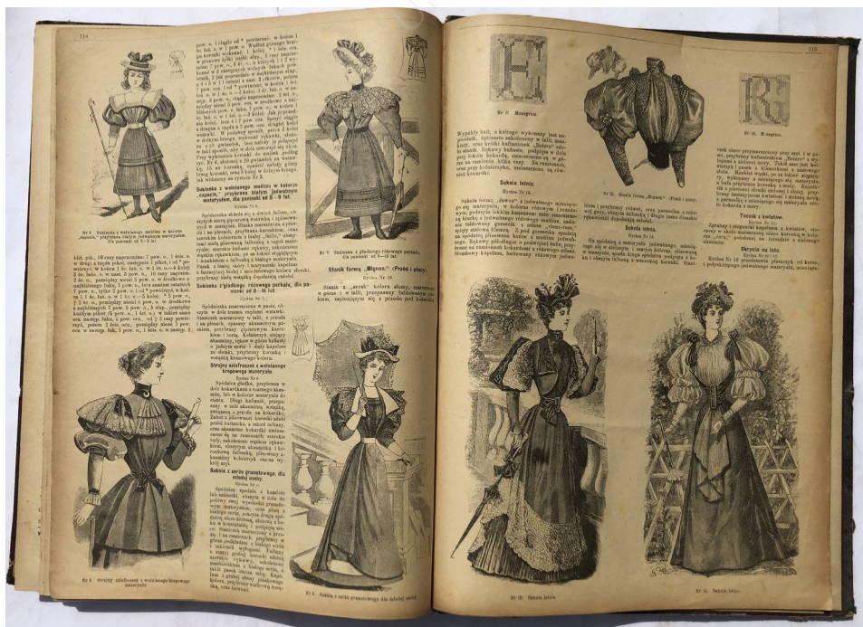
Ryc. 1. „Bluszcz. Pismo tygodniowe ilustrowane dla kobiet” 1894, nr 30 (dodatek)

wzbudza erotyczny pociąg nie tylko u swojego męża, ale i u innych mężczyzn. Co istotne, Franek, który jest świadomy wrażenia, jakie wywiera na otoczeniu jego żona, cieszy się z tego, a nieukrywaną satysfakcję sprawia mu wyobrażenie sobie spotkań na Czystym z mężczyznami, którzy zachwyconym spojrzeniem obdarzą Józkę, jemu zaś będą „znacząco mrugali”. W tej postawie mężczyzna, a zwłaszcza w ich spojrzeniach, Franek będzie odczytywał podziw i pożądanie dla żony, dla siebie zaś męskie uznanie. Józce w ogóle nie przeszkadza ani to, że będzie oglądana przez obcych mężczyzn, ani to, że na ten widok wystawia ją własny mąż oraz... ona sama. Bohaterka nie protestuje zarówno w mieszkaniu, gdzie jest oglądana przez męża (który równocześnie ocenia jej wygląd: „obchodził [ją] ze wszech stron, pociągał, poprawiał. Palcem poślinić już się nie ważył. Brał w zamian szcztokę i czyścił skrupulatnie”; Berent 1992c: 73), jak i podczas wycieczki, gdy co rusz natyka się na uważny męski wzrok. Erotyczna moc spojrzenia znana jest od starożytnej opowieści o Meduzie. Będąc potworem, a w zasadzie potworną emanacją kobiecej seksualności, niosła za sobą i obietnicę rozkoszy, i pożarcie przez śmierć. Toteż „wskutek pożądania, obejmującego