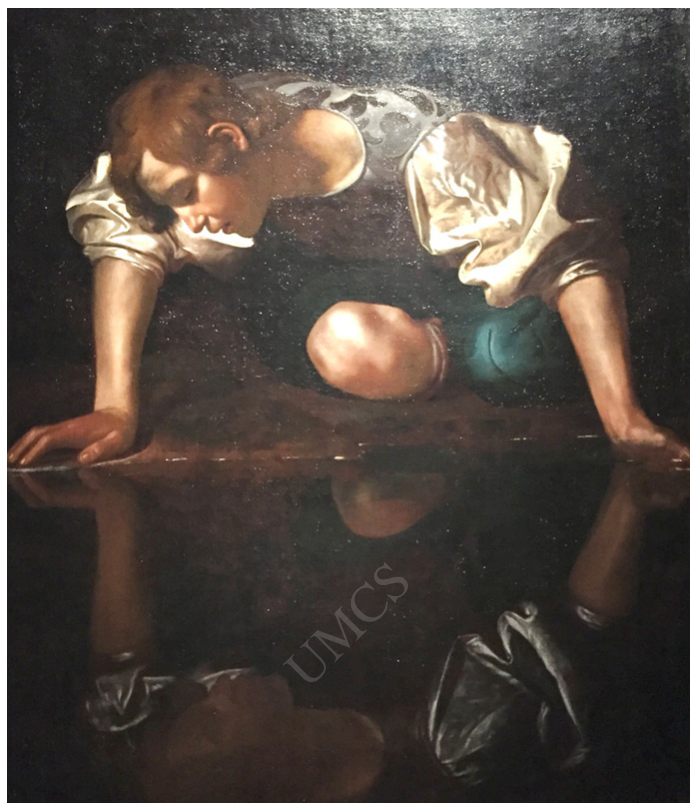
Ilustracja 1. Caravaggio Narcyz , 1597–1599 (Palazzo Barberini w Rzymie)