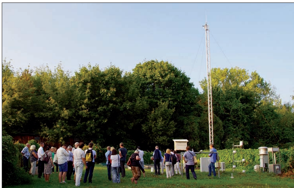
Fot. 5. Warsztaty terenowe w Ogrodzie Botanicznym UMCS