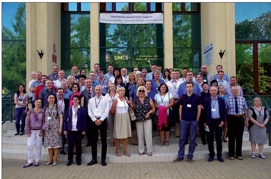
Fot. 4. Uczestnicy IV Ogólnopolskiej Konferencji Metodycznej „Problematyka pomiarów i opracowań elementów meteorologicznych” podczas pamiątkowego zdjęcia przed budynkiem Wydziału Nauk o Ziemi i Gospodarki Przestrzennej UMCS