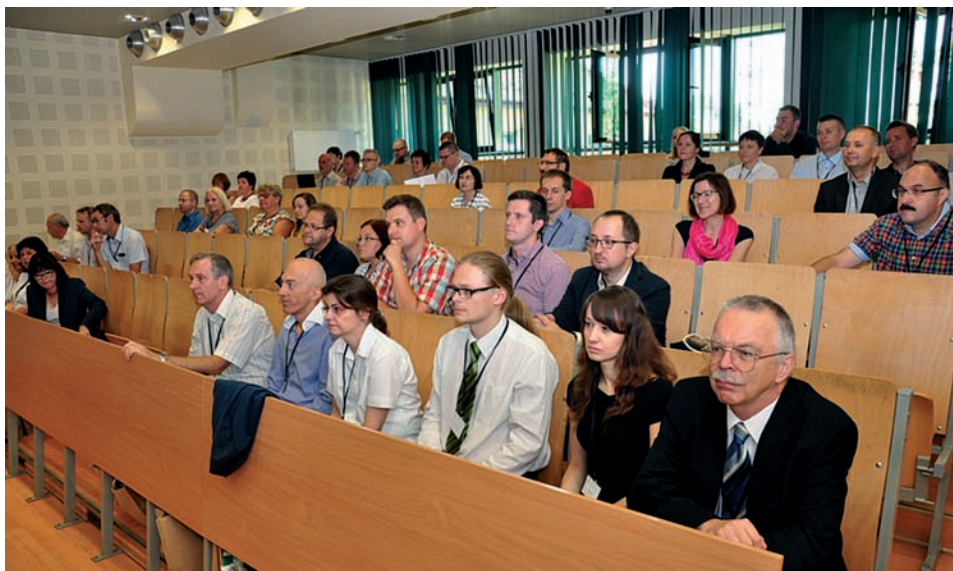
Fot. 3. Obrady IV Ogólnopolskiej Konferencji Metodycznej „Problematyka pomiarów i opracowań elementów meteorologicznych”