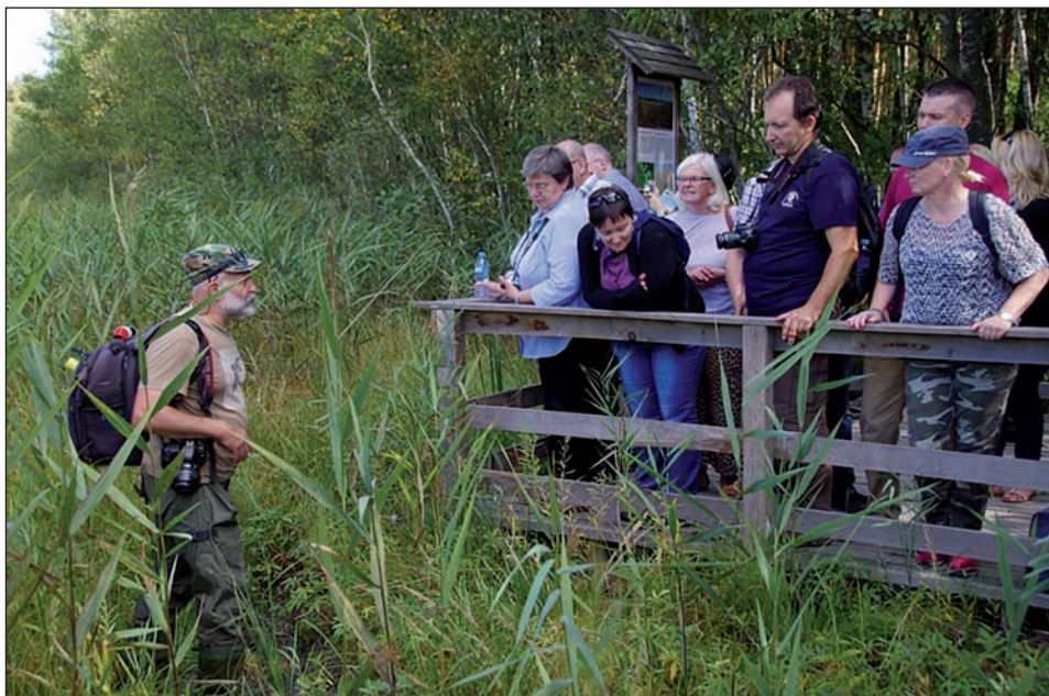
Fot. 6. Sesja terenowa „Problemy ochrony przyrody Polesia Lubelskiego”