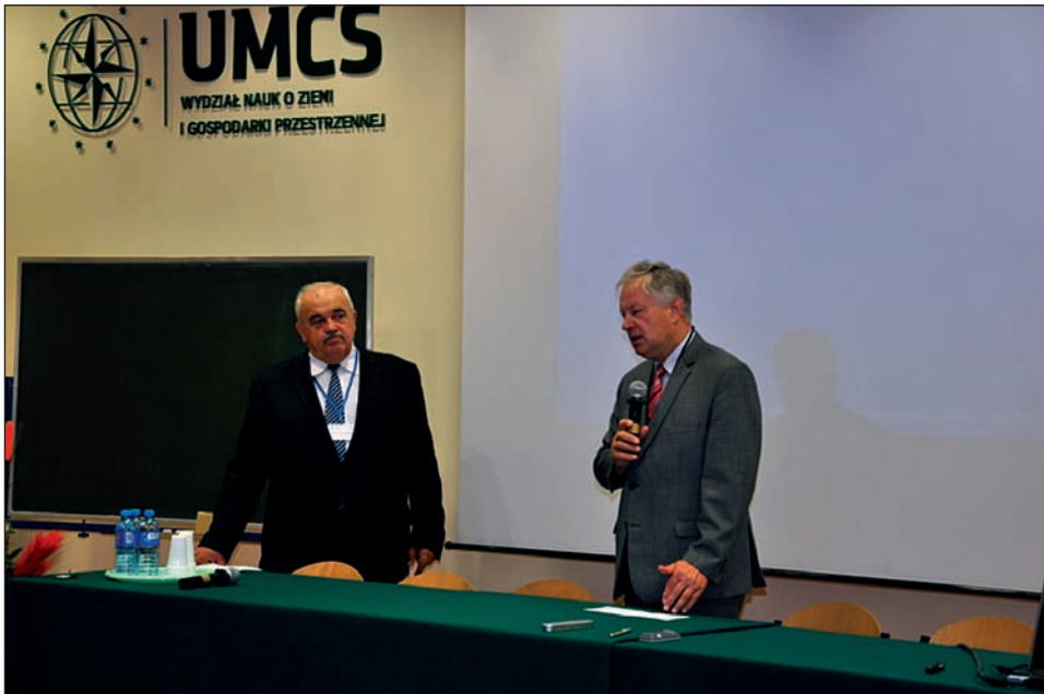
Fot. 1. Otwarcie IV Ogólnopolskiej Konferencji Metodycznej „Problematyka pomiarów i opracowań elementów meteorologicznych”

Zorganizowana przez ośrodek lubelski IV Ogólnopolska Konferencja Metodyczna „Problematyka pomiarów i opracowań elementów meteorologicznych” w opinii uczestników uznana została za bardzo ważną. Dostrzeżono potrzebę kontynuowania dyskusji w zakresie problematyki pomiarów meteorologicznych i opracowań klimatologicznych na kolejnych spotkaniach i konferencjach.